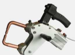
CAR POINT 8 GUN