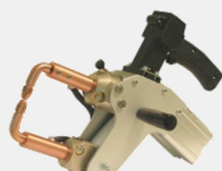
CAR POINT 11 RF/EUROPEI GUN